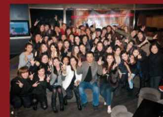
▲ Spa Collection集團為員工舉辦不少內部活動，既可舒緩工作壓力，同時更能提升各員工對公司的歸屬感及凝聚力。