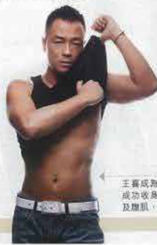
主賓成為亞當的代言人後，成功收身，更擁有健碩胸肌及腹肌，散發男人魅力。

亞當男士美容纖體中心明白男士對健碩身形的追求，但單靠運動，未必能趕及在今個夏天大曬結實胸肌與腹肌。亞當引入先進的VRF塑身練肌技術，以先進射頻與負壓技術，針對皮下脂肪作出定位，以每秒500萬頻率高能量微波，快速燃燒脂肪，同時結實肌肉與體形，從而塑造理想體態。