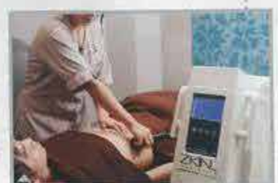
專業治療師用儀器為客人進行修緊腹部肌肉療程，過程輕鬆簡單。