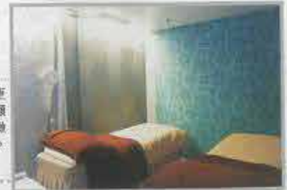
房間光猛潔淨，更特設二人房間，顧客可與友人一同做 treatment，不致寂寞。

男士皮膚不一定是天生暗啞粗糙，只要有適當的護理，男士同樣可擁有嫩滑肌膚。全新的納秒激光細胞重組療程，以柔膚激光能量刺激皮膚蛋白膠原組織增生，能修護及緊緻老化肌膚，消除多餘油脂，收細毛孔及改善暗啞枯黃的膚色，瞬間令皮膚變得光滑無瑕。