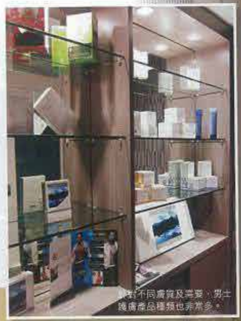
针对不同膚質及需要，男士護膚產品種類也非常多。